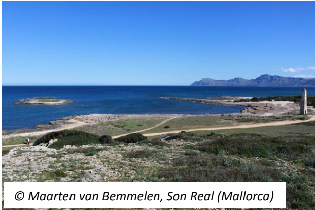
© Maarten van Bemmelen, Son Real (Mallorca)