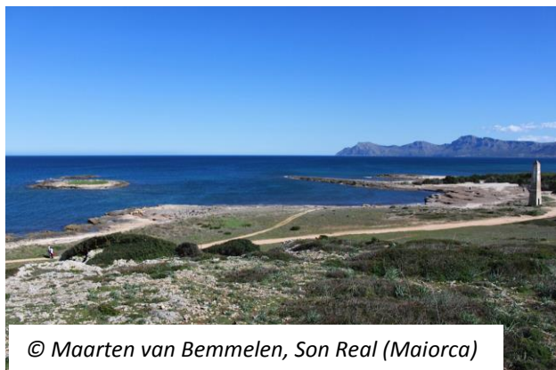
© Maarten van Bemmelen, Son Real (Maiorca)