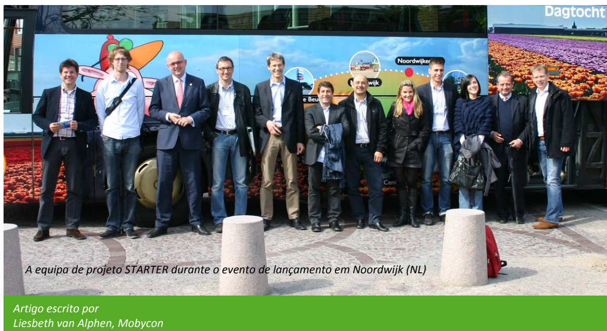
A equipa de projeto STARTER durante o evento de lançamento em Noordwijk (NL)

Newsletter conjunta dos projetos SEEMORE e STARTER