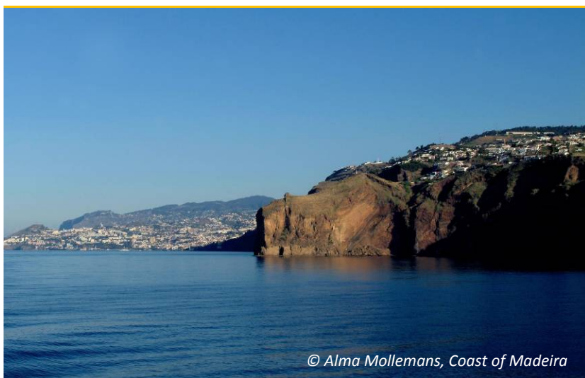
© Alma Mollemans, Coast of Madeira