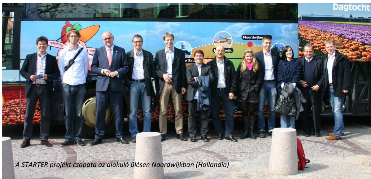
A STARTER projekt csapata az alakuló ülésen Noordwijkban (Hollandia)

A SEEMORE és STARTER projekt közös elektronikus hírlevele